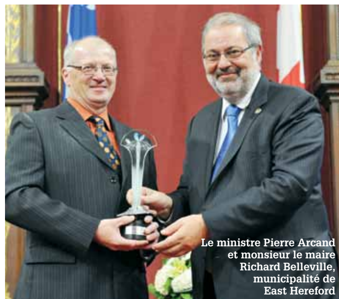
Le ministre Pierre Arcand et monsieur le maire Richard Belleville, municipalité de East Hereford

Inspirée des expériences d'ici et d'ailleurs ainsi que de nombreuses discussions avec les agriculteurs, la Municipalité régionale de comté de Coaticook a mis en place un programme flexible et efficace pour la récupération des plastiques agricoles sur l'ensemble de son territoire. Le programme, réalisé en partenariat avec l'Union des producteurs agricoles de Coaticook, a permis, en 2010, de récupérer 204 tonnes de plastique auprès de 264 agriculteurs. Il s'agit d'un taux de participation de 81 %, un résultat exceptionnel pour une première année!