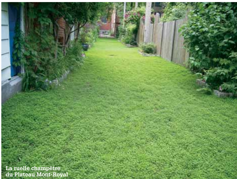
La ruelle champêtre du Plateau Mont-Royal

Le projet de ruelle champêtre avait pour objectif de créer un modèle de transformation de ruelles intégrant, entre autres, l'écoulement et la filtration des eaux de ruissellement, la diminution du débit d'eau dans les égouts et l'amélioration de la qualité de l'air en agrandissant l'espace vert local. La ruelle champêtre vise également à rendre les ruelles plus attrayantes pour inciter les résidents à les entretenir davantage et pour sensibiliser le public à l'importance de la nature en ville.